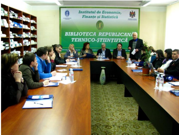
Schimb de opinii și experiențe în cadrul Programului de instruire pentru cercetători, Grant acordat de organizația olandeză NUFFIC, 2013