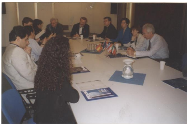
Stagiere în Marea Britanie, 1997