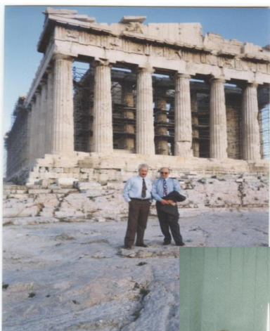
Stagiere în Grecia, Atena, 1997.