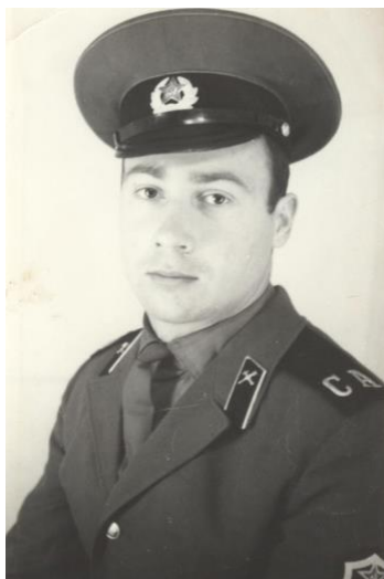
Serviciul militar în Germania, 1971