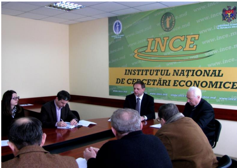
Prezentarea rezultatelor proiectului de cooperare moldo-ceh "Suportul integrat pentru dezvoltarea statisticii demografice în Republica Moldova, 2013-2015.