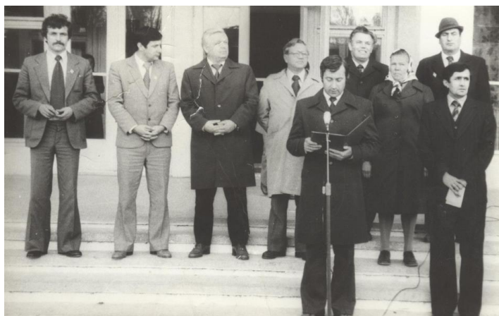
Deschiderea casei de cultură din s. Svetlâi, 1982 F. Bajura – prezintă raportul de activitate la adunarea festivă .