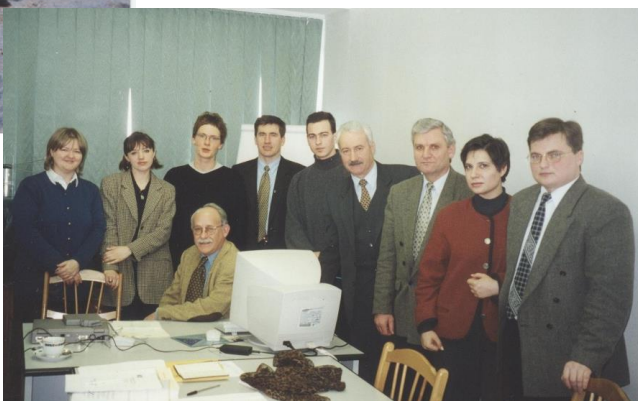
Membrii grupului de lucru în proiectul TACIS, 1998.