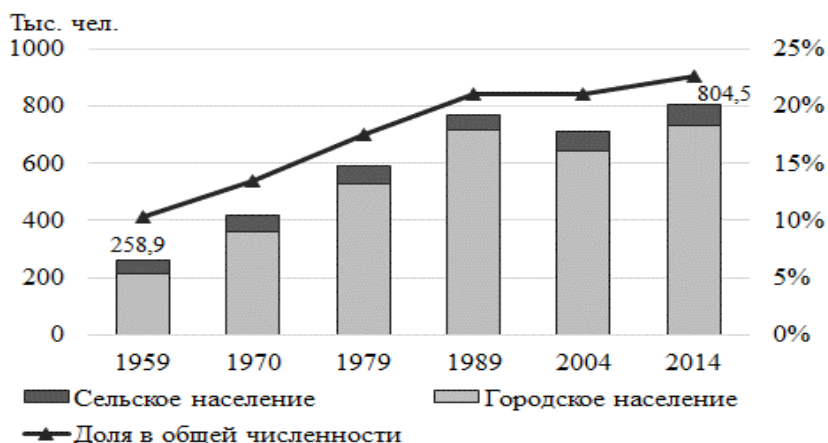
Рисунок 1. Динамика численности населения мун. Кишинэу по типам поселения, тыс. человек, 1959 – 2014 гг.

Волны сельской миграции в Молдове, повлекшие рост городского населения, характерны для периода 1960-1980 гг., они оказали влияние на процесс урбанизации, прежде всего, столичного региона, тем самым сформировав два наиболее проблемных направления: концентрация городского населения, с одной стороны, и адаптация консервативных сельских жителей к городской жизни – с другой. Интенсивную положительную динамику численности населения Кишинэу в межпереписные периоды с 1959 г. по 1989 г. наглядно демонстрируют их итоги, согласно которым город прирастал на 61%, 42% и 31% соответственно. Однако начиная с 1990 г. прирост сменяется стагнацией – наблюдаемые изменения численности жителей Кишинэу были незначительными, зафиксировав колебания показателя на уровне 718 тыс. человек (Рис.1).