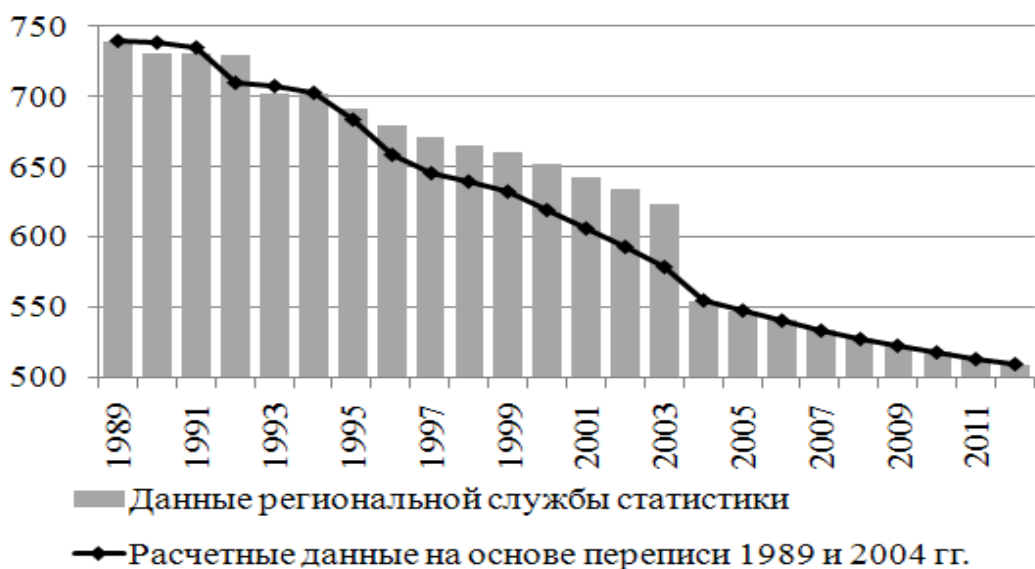
Рисунок 1. Изменение общей численности населения, тыс. человек, 1989–2012 гг.

перераспределения миграционного сальдо в Приднестровье, основываясь на результатах ближайших переписей населения (Рис.1).