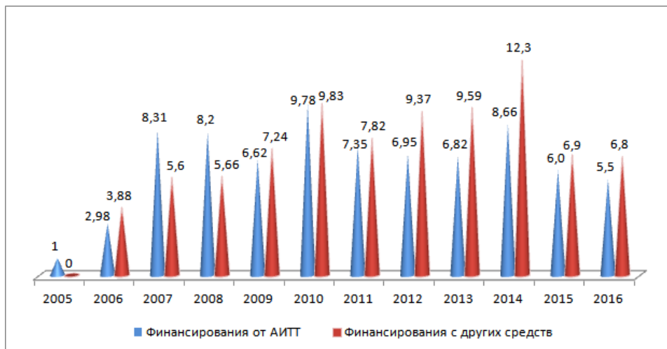
Рисунок 1. Государственное финансирование для развития НТП и ИИ, млн. лей

Динамика финансирования проектов по трансферу технологий за период 2005-2016 гг. представлена на рисунке 1.