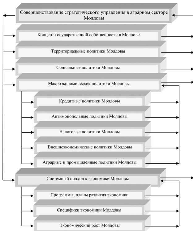
Рис. 3. Блок-схема «Совершенствование стратегического управления в аграрном секторе Молдовы»

В клиентской составляющей инициативы поддерживают две основные задачи: качество продукции и высокое качество обслуживания. За счет управления качеством аграрной продукции коэффициент возврата сократится на 50%, и учитывается положительным постоянством 60% клиентов. Данные инициативы соз-