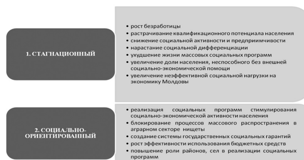
Рис. 1. Сценарии развития Молдовы в среднесрочной перспективе