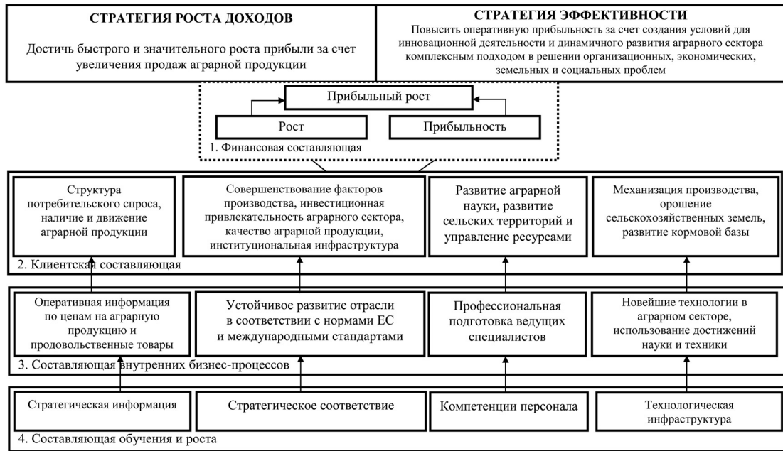
Рис. 4. Инновационная стратегическая карта предприятий аграрного сектора Молдовы