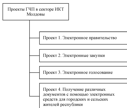
Рис. 1. Проекты ГЧП в секторе ИКТ Молдовы

Без положительного вмешательства государства молдавские софтверные компании (несмотря на хорошую систему образования, институты развития, налоговые льготы, гранты от фондов) будут существовать только на дальней периферии технологических рынков и продуктов. Они не смогут самостоятельно осуществить представленные на рис. 1 проекты, которые требуют не только больших финансовых средств, но и желание властей внедрять инновационные элементы в систему управления. Внедрение вышеперечисленных проектов ГЧП способствовало бы быстрому продвижению Молдовы на лидирующую позицию в данной области среди стран ЕС.