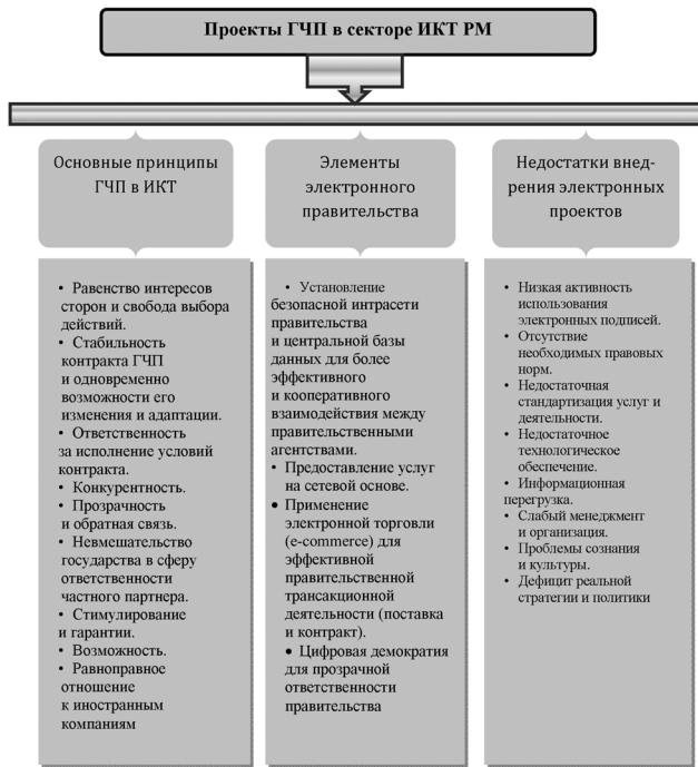
Рис. 2. Основные принципы, элементы и недостатки внедрения электронных проектов в Молдове