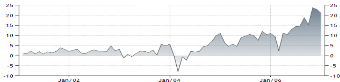
Fig. 3: Balanța comercială a Chinei: ianuarie 2001 - ianuarie 2007 (mld. USD)