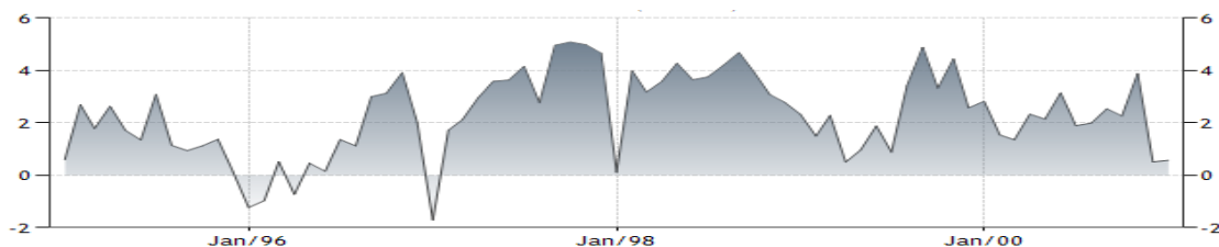
Fig. 2: Balanța comercială a Chinei: decembrie 1994 - ianuarie 2001 (mld. USD)

de către principalii actori ai pieței comerciale ca urmare a ratei de creștere ridicată înregistrată de către China, care privea optimistă către viitor, SUA și statele fondatoare ale CEE, în special, au recurs la orice modalitate pentru a îngădi participarea chineză la schimburile comerciale internaționale, sugerându-i că cea mai bună strategie pe care ar putea-o îmbrățișa s-ar reduce la nivelul regiunii, respectiv la comerțul intra-regiune în cadrul ASEAN-ului.