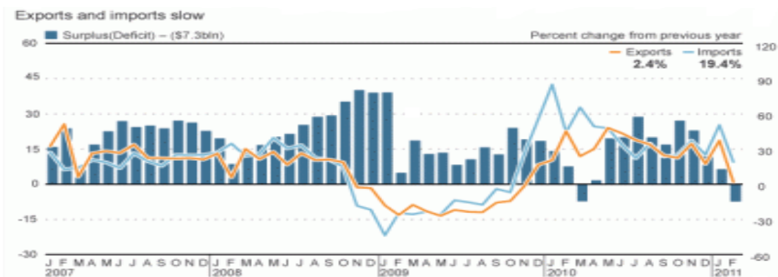
Fig. 4: Balanța comercială a Chinei: ianuarie 2007 - februarie 2011 (mld. USD)

De-a lungul anilor, China și-a crescut fluxul de import și export către celelalte state ale lumii. Valoarea totală a importurilor și exporturilor la nivelul anului 2007 a atins 2.174 miliarde USD, aspect care nu a făcut altceva decât să propulseze statul chinez în rândul celor mai mari, dezvoltate și prospere națiuni din lume, a treia după SUA și „locomotiva Europei”.