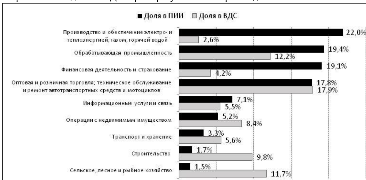
Рис. 2. Сравнение доли секторов экономики в ПИИ и ВДС в 2019, %

техническое обслуживание и ремонт автотранспортных средств и мотоциклов” (17,8%). Не все сектора с высокой долей в ВДС характеризуются соизмеримой долей ПИИ.