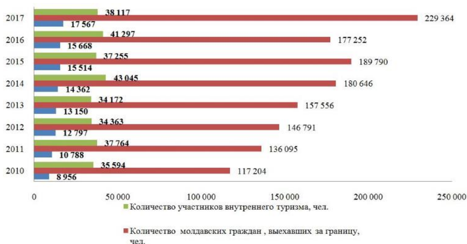
Рис. 1. Показатели туристического потока в Республику Молдову посредством туристических агентств и туроператоров в период 2010-2017 гг.

В 2017 году, по сравнению с 2016 годом, туристические агентства и туроператоры предоставили туристические услуги 285 тыс. туристов, что на 21,7% больше. Рост числа туристов был обусловлен увеличением числа участников выездного туризма на 29,4% (число выехавших за границу составило 229364 тыс. туристов) и принимающего туризма на 12,1% (число туристов составило 17567 тыс.). Количество туристов, принимавших участие во внутреннем туризме в 2017 году, составило 38,1 тыс. туристов, сократившись на 7,7%. Из 17,5 тыс. иностранных туристов, которые посетили Республику Молдова в 2017 году и воспользовались услугами туристических агентств и туроператоров, для отдыха и оздоровления 78,3%, бизнес и профессионал 17,2 % и 4,5% на лечение.