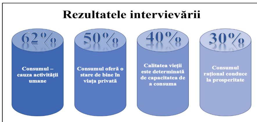
Figura 3. Consumul în viziunea moldovenilor