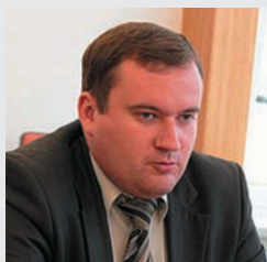
Владимир ЯСТРЕБЧАК, экс-глава МИД Приднестровья, политический эксперт

Пока сложно говорить о серьезных изменениях в реальном секторе экономики Молдовы. Падение отмечено по отдельным товарным группам, но пока еще не привело к существенным последствиям для молдавской экономики. Молдавские власти пытаются предпринимать усилия для того, чтобы смягчить негативный эффект для некоторых экспортеров; кроме того, активно изыскиваются возможности для того, чтобы обойти российские запреты через иные «точки доступа» на рынок России. Вполне возможно, что в Кишиневе попытаются привлечь и внешние финансовые ресурсы для поддержки уязвимых отраслей, однако вряд ли эти перспективы реалистичны.