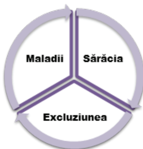
Figura 1. Cercul vicios al excluziunii sociale

Altfel stau lucrurile la o persoană vârstnică medie. Având în spate o viață muncitorească lungă. Iar rezultatul său devenind o situație financiară dezastruoasă care provoacă privarea chiar și de necesitățile de bază. Zilele petrecute între patru pereți. O izolare tot mai pronunțată de la viața socială. Tot mai puțină comunicare, condiții de trai tot mai rele. Viața de zi cu zi nu adaugă optimism. Valoarea calorică și calitatea alimentației nu corespund nevoilor fiziologice. La persoană bătrână și lucrurile sunt vechi. Pentru procurarea noilor elementar nu sunt bani. Tot mai dese sunt stările depresive, se înrăutățește sănătatea. Și, drept consecință, crește necesitatea de procurare a medicamentelor mai scumpe (în a.2015 prețurile de la producător la medicamente vor crește în medie cu cinci la sută, iar prețul final poate fi și mai mare [1]. Sărăcirea – este un proces progresiv și sever. Una atrăgând după sine alta, și procesul dat este infinit (figura 1).