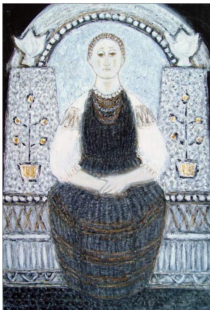
Ada Zevin. Mărgăritare , 1967, u/p, tempera, 110 × 80 cm

24. Zakon Turkmenistana «O prodovol'stvennoy bezopasnosti» ot 15.06.2000 g. № 29-II, http://base.spininform.ru/show_doc.fwx?rgn=3176 [accesat 11.07.2018].